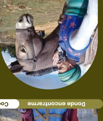
Donde encontrarne Coordenadas: 40.531932, -0.618639

La señalización de carreteras y nieve En esta instalación hemos reunido diferentes elementos que han servido para señalar los primitivos caminos y las carreteras, además de instalar también muestra de los diferentes elementos que se han utilizado para orientarse durante las nevadas. Esta curiosa instalación está en el Camino de los Pilonos entre Fortanete y La Iglesuela del Cid.