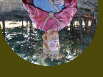
Donde encontrarne Coordenadas: 40.514417, -0.701636

El tratante El tratante es un personaje que transporta mercancías de un lugar a otro. En este caso, nuestro tratante transporta la lana que producen los ganados de esta tierra hacia las costas de Levante, donde saldría para destinos remotos donde era bien apreciada. Su figura se halla en el Camino de los Pilonos entre Villarroja de los Pinares y Fortanete, en la conocida como Sierra de la Lastra. Lo encontrarás en el camino.