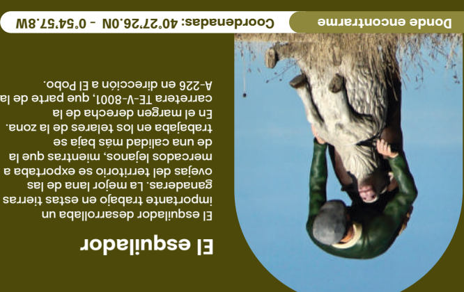
Donde encontrarne Coordenadas: 40°27'26.0N - 0°54'57.8W

Entre Teruel y La Iglesuela del Cid se conservan diferentes tramos de caminos con pilones y son los que ahora se ponen en valor para crear este nuevo itinerario, que se ha relacionado con el tránsito de mercancías y el comercio de la lana y otras materias primas. Además, es conocido también como "el camino de Jaime I" porque este monarca transitó posiblemente por este mismo trazado en al menos un par de ocasiones entre los años 1231 y 1259. El camino enlazaba Teruel con Morella y el Levante y aparece documentado en el "Libre dels Fets", crónica histórica que relata la vida y las gestas del rey.