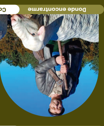
Donde encontrarne Coordenadas: 40.479370, -0.361941

Personajes del camino Todo el camino está señalizado, y puedes hacerlo por etapas, disfrutando de todo su encanto. Además, los personajes que vas a encontrar en el trayecto, te ayudarán a conocer y comprender la historia y la importancia del camino. Alguno de ellos te los vas a encontrar a pie de carretera, otros, tendrás que seguir las indicaciones que encontrarás en ella.